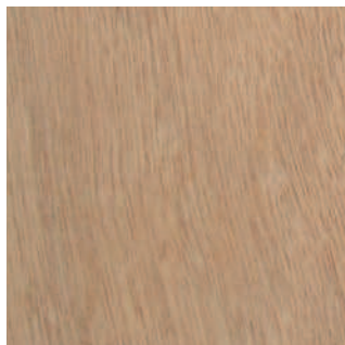
Tinta naturale/ Natural