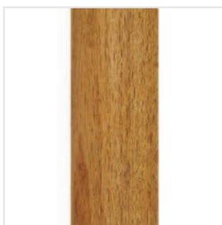
Tinta iroko/ Iroko