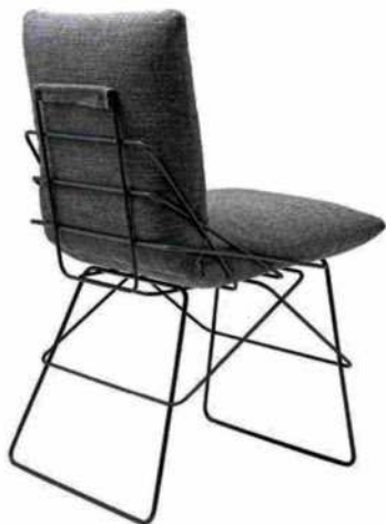
Driade, Sof Sof