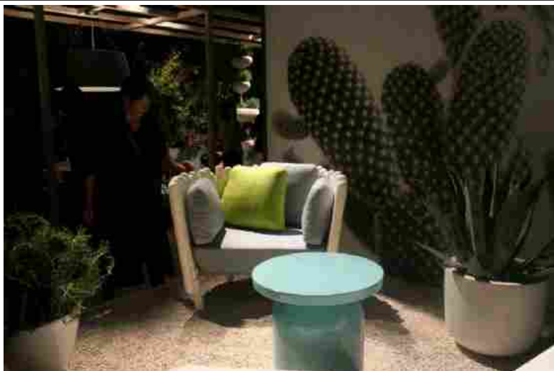
Arred: Serralunga (DIARIDELWEB.IT)

Innovazione dei materiali, design e freschezza si mischiano quindi insieme in un cocktail davvero eccezionale, invogliando i visitatori a concedersi un attimo di relax in un Salone del Mobile che, già dal primo giorno, ha dimostrato ancora una volta la qualità del Made in Italy, imparagonabile.