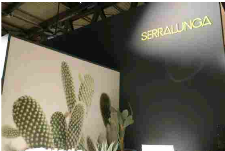
Arred: Serralunga

L'azienda è stata fondata a Biella nel 1825. Il nome è quello della famiglia che da sei generazioni è il cuore pulsante, sia creativo che imprenditoriale, dell'azienda, produttrice di arredamento per esterni. La storia di Serralunga è ricca di particolari e sorprese, quella di un'azienda che - nel corso degli anni - è stata in grado di rinnovarsi più volte a seconda del mercato. L'azienda, infatti, nacque come conceria per passare poi alla lavorazione del cuoio per scopi industriali. Siamo nel biellese, terra famosa in tutto il mondo per la sua eccezionale industria tessile. Ma la vera rivoluzione arrivò con la lavorazione della plastica e poi con l'importazione dagli Stati Uniti del sistema di rotational design dal quale ne derivano moltissimi mobili moderni e oggetti per l'illuminazione esterna, tutto design made in Italy.