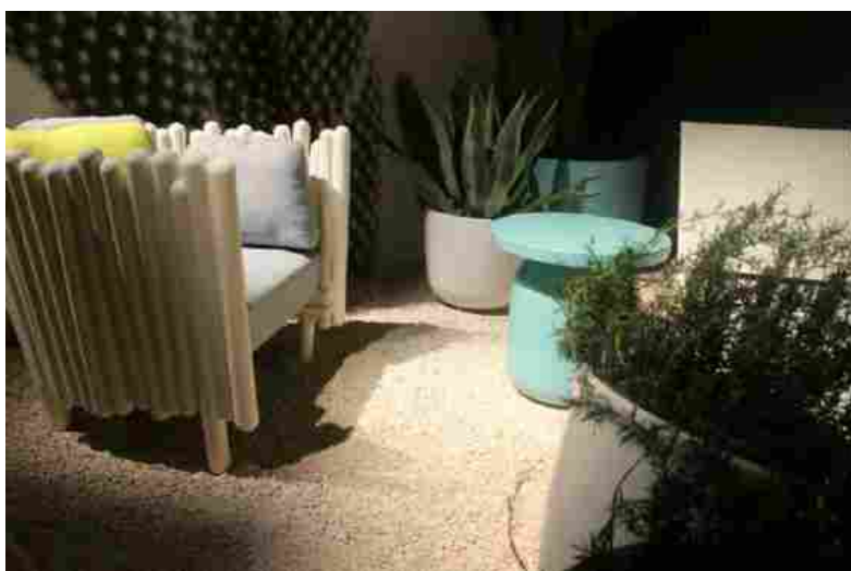
Arredi Serralunga

BIELLA - I primi giorni di Salone del Mobile non hanno di certo deluso le aspettative. Complice un'inaspettata calura estiva, turisti, imprenditori e curiosi hanno potuto perdersi tra gli oltre 1300 espositori dislocati egregiamente all'interno dei 12 padiglioni di Rho Fiera, tra salotti innovativi e tecnologie domestiche all'avanguardia. Al Salone del Mobile non trovano, però, spazio solo gli interni delle abitazioni, docce in vetro e amache all'ultima moda, ma anche arredamenti per esterni. Ne è un esempio Serralunga , azienda biellese che potete trovare in questi giorni al Salone del Mobile al