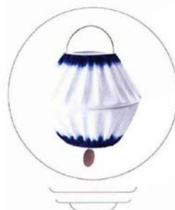
Suspension 'Solvinden', éclairage LED à énergie solaire, 14,95 €, Ikea.