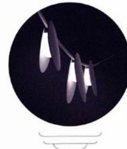
Guirlande lumineuse de la coll. 'June', à trois ou cinq éléments, à pd 925,65 €, Vibia.