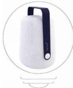
Lampe nomade 'Balad', design Tristan Lohner, à poser ou à fixer sur un pied, LED rechargeable, 68 €, Fermob.