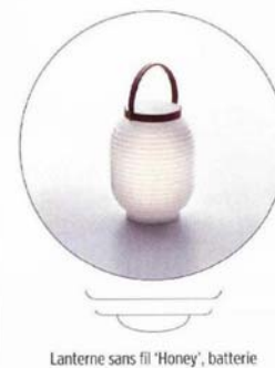
Lanterne sans fil 'Honey', batterie rechargeable, design Raffaella Mangiarotti et Marco Ravina, 181,5 €, Serralunga.