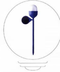
Lampe à énergie solaire 'Clover Garden', à planter dans un pot ou dans le sol, design Inna Vautrin, 39 €, Lexon.

"Généralement, la terrasse jouxte l'habitation. Ne perdez donc pas de vue l'influence de l'éclairage intérieur."