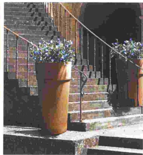
Ein praktisch zylindrisches Gefäß ist das neue „Cono H105“ von der Bamagroup.