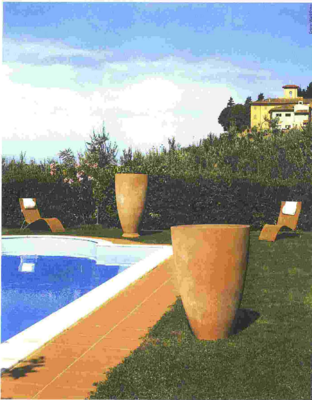
Ein modernes schlichtes Design hat das Modell „Calice“ von Terrecotte Poggi Ugo.