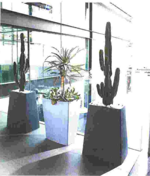
Genial innovativ sind die Gefäße der „Reverso“-Kollektion von Deroma. Sie können von beiden Seiten genutzt werden.