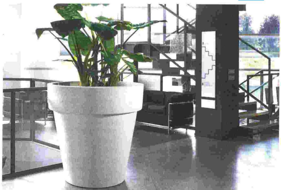
Das Gefäß „Standard One“ von Teraplast gibt es nun auch mit einer Höhe von 140 cm.